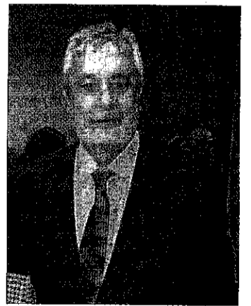
■ José Antonio Griñán.

Así mismo, han sido invitados a este acto las organizaciones agrarias más importantes, como ASAJA, COAG o UPA, así como una amplia representación de clientes, proveedores y de trabajadores de Vicasol.