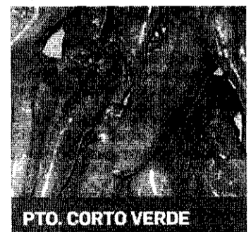
PTO. CORTO VERDE